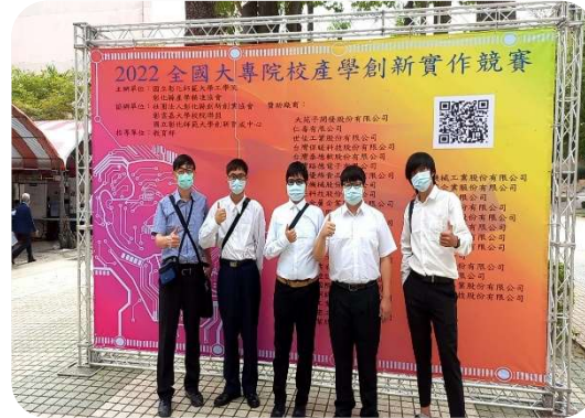
2022全國大專院校產學創新實作競賽 入圍決賽