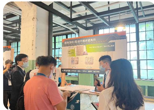
2022第六屆慈悲科技創新競賽 特別獎