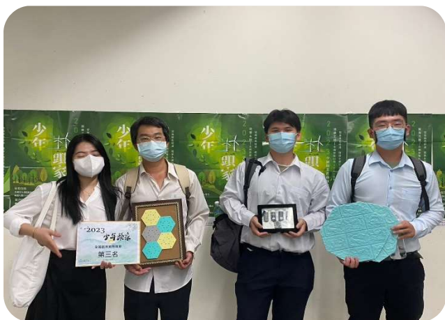
2023少年頭家全國創業實務競賽 第三名