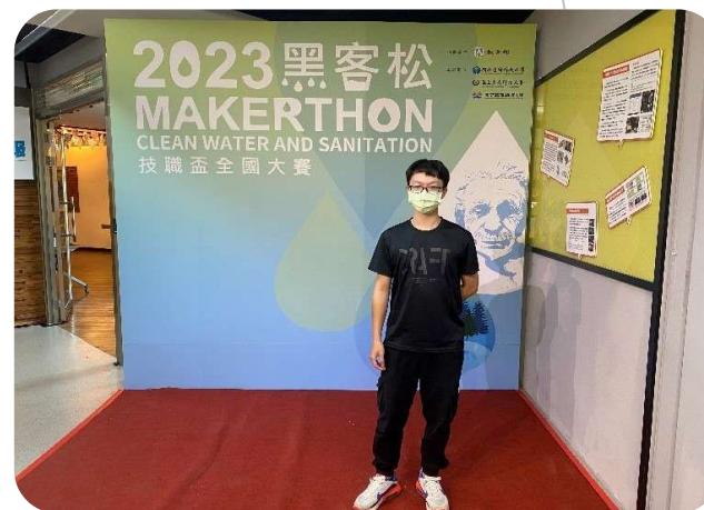
2023黑客松：技職盃全國大賽