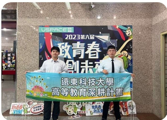
2023第6屆致青春·創未來 全國選拔大賽 銀牌