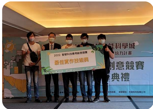
2022 智慧科技應用創意競賽 最佳實作技術獎