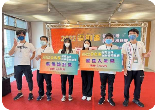
2022年雲創盃智慧生活創新應用競賽 最佳設計獎、最佳人氣獎