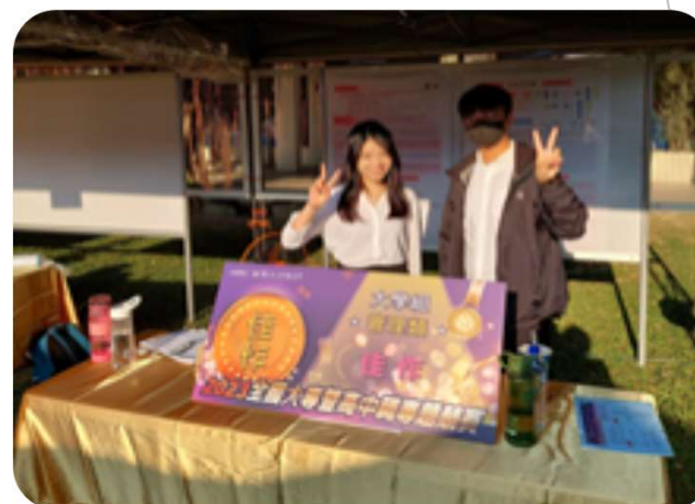
2023全國大專暨高中職學生專題製作競賽 佳作