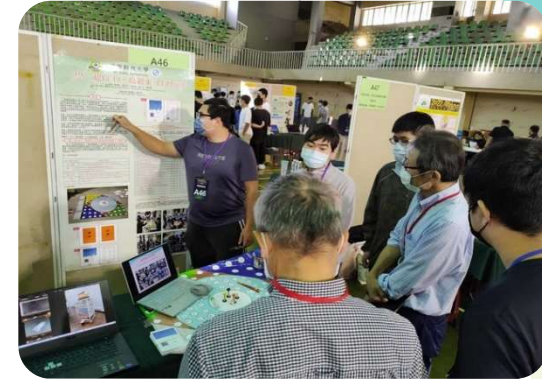
萬潤2022創新創意競賽 入圍